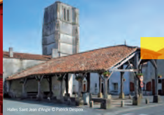
Halles Saint Jean d'Angle