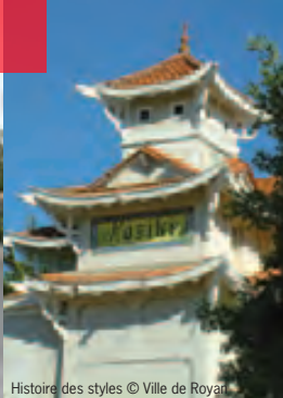
Histoire des styles