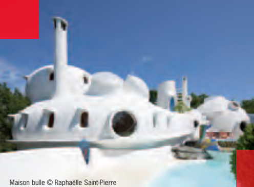
Maison bulle © Raphaëlle Saint-Pierre