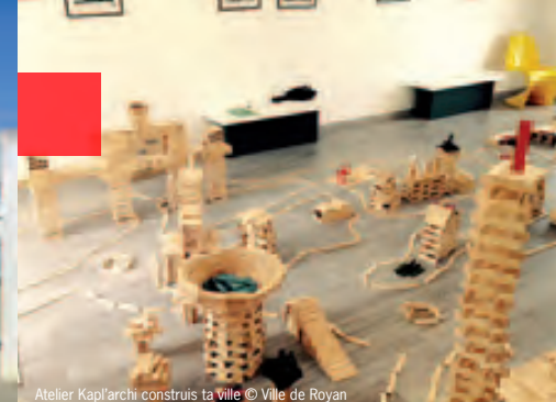
Atelier Kapl'archi construis ta ville