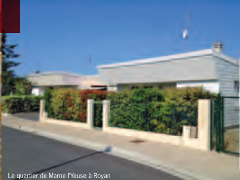
Le quartier de Marne l'Yeuse à Royan