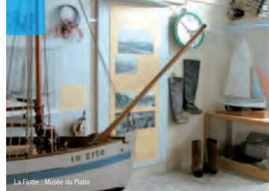
La Flotte : Musée du Platin