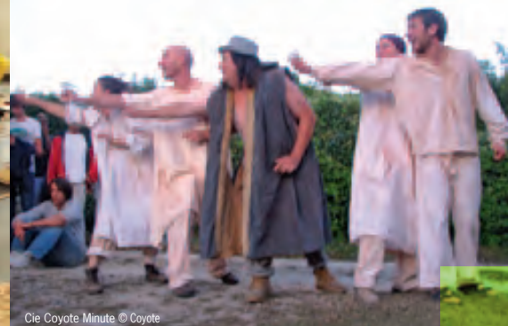
Cie Coyote Minute