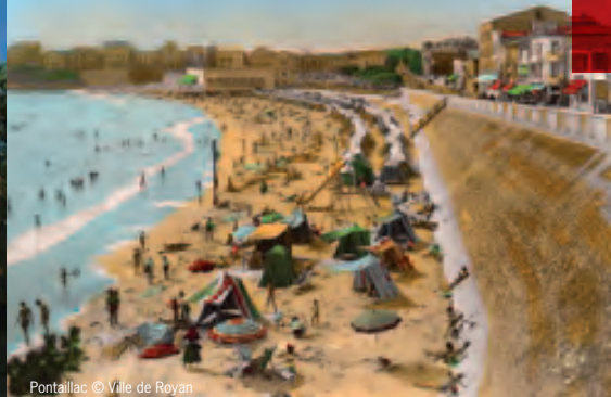
Pontailiac © Vale de Royan