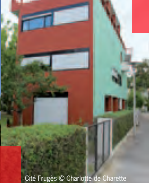
Cité Frugès