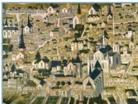
La Cathédrale Saint-Pierre de Poitiers, éd. Geste. Détail du tableau (1619) de François Nautré figurant le siège de Poitiers en 1569.

Au sein du Centre d'études supérieures de civilisations médiévales (université de Poitiers/CNRS), des chercheurs de diverses spécialités (histoire de l'art, architecture, archéologie, archivistique, photographie, langues, patrimoine, ingénierie) ont étudié la cathédrale Saint-Pierre de Poitiers dont le chantier débuta au XII e siècle. Une monographie en neuf enquêtes consacrées à la structure architecturale et aux décors (sculpture, peinture, vitraux) de l'édifice. Plans d'après relevés lasergrammétriques, documents anciens, photographies actuelles, dessins, schémas.