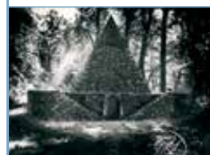
Le Désert de Retz , éd. Gourcuff Gradenigo. La pyramide glacière du jardin de Retz réalisée en 1781 à Chambourcy.