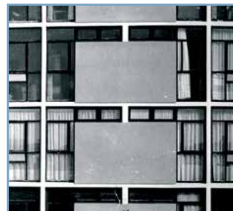
La Cité de l'Étoile à Bobigny, éd. Créaphis. Détail de façade de la cité (1955), Candilis - Josic - Woods arch.

Dir. Richard Klein Paris, Créaphis , 2014 (Coll. Lieux habités) 160 p., ill. noir et coul., 16,5x22,5, 20 € ISBN 978-2-35428-082-6 Publié avec le soutien du ministère de la Culture et de la Communication, Direction générale des patrimoines, service de l'architecture Commandée en 1955 par Emmaüs, la cité de l'Étoile à Bobigny, un grand ensemble de plus de 700 appartements (G. Candilis, A. Josic, S. Woods arch.), fait partie de l'Opération million (un 3 pièces pour moins d'un million de francs) lancée par l'État afin d'endiguer la crise du logement. Nécessitant une rénovation, la cité, labellisée Patrimoine du XX e siècle (2008), a fait l'objet d'une mission d'expertise en 2010 par les auteurs (des architectes et un historien), afin d'élaborer un projet de restructuration urbain, durable et patrimonial. Genèse du projet, programme architectural,