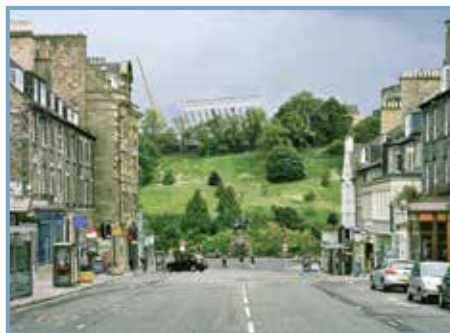
Geum urbanum , éd. Filigranes. Zone périurbaine à Édimbourg en juin 2011.

Bruxelles, Mardaga/CIVA , 2014 240 p., ill. noir et coul., 23x28, 45 € ISBN 978-2-8047-0170-3 Publié à l'occasion de l'exposition éponyme organisée au CIVA, à Bruxelles, du 21/2 au 4/5/2014 Depuis les années 1980, l'architecte, urbaniste et artiste Françoise Schein intervient dans l'espace public en réalisant des œuvres humanistes et monumentales touchant aux thématiques "civiques" (station Concorde à Paris, 1991) et cartographiques (carte de métro flottant sur un trottoir de New York, 1985). En collaboration avec des habitants et des associations, elle inscrit sur les murs de villes à travers le monde les droits fondamentaux humains comme à Rio de Janeiro (Le Chemin des droits humains, 2000) ou à Ramallah (La Ville, arbre des droits humains, 2011). Ouvrage monographique richement illustré et commenté.