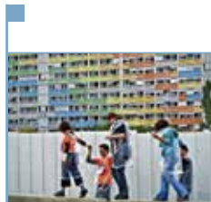
Art et renouvellement urbain, éd. Privat. Projet Sputnik : balade ludique dans le quartier de la Duchère à Lyon.

Comment bien vieillir chez soi? L'auteur, architecte, et des contributeurs spécialisés en démographie, sociologie, psychologie, économie et en droit analysent comment l'habitat individuel doit, au fil du temps, s'adapter, à de nouvelles exigences et à de nouveaux usages (agrandissement familial, densification, perte d'autonomie...). Propositions de solutions pratiques accompagnées de douze projets exemplaires (extension, subdivision, surélévation, accessibilité...). Plans, photos, schémas.