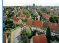
Bruxelles , éd. Prisme. Avenue des Agneaux (1999), vue depuis la tour Floréal à Bruxelles.