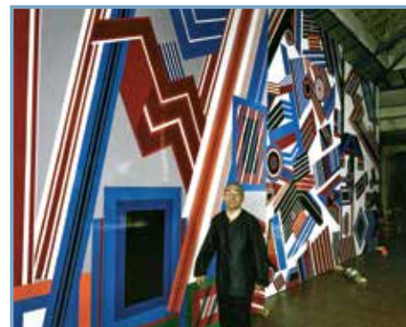
Jean Dewasne , éd. Somogy. J. Dewasne dans son atelier, devant les panneaux pour la Grande Arche de la Défense.

Dir. Patrice Deparpe Paris, Somogy , 2014 224 p., fçs/angl., ill. noir et coul., 29,5x24,5, 35 € ISBN 978-2-7572-0795-6 Catalogue commun à trois expositions sur Jean Dewasne présentées, entre mars 2014 et février 2015, au Cateau-Cambrésis, à Cambrai et à Dunkerque Entre peinture, architecture, sculpture, musique, philosophie, sciences et industrie, le travail de l'artiste français Jean Dewasne (1921-1999) - un des maîtres de l'abstraction constructive - touche à de nombreux registres dont ceux de la fresque (pour le stade de Grenoble en 1968 et pour l'Arche de la Défense à Paris en 1989) et de l'anti-