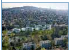
Animal ? , éd. Presses du réel/PPUR. Étude pour Novartis Pharma France à Rueil-Malmaison (2010), Patrick Berger, Jacques Anziutti arch.