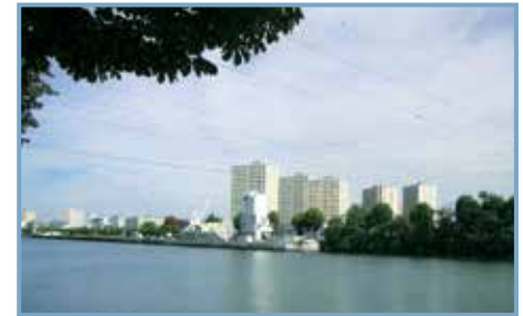
Projets urbains sur Seine, éd. de la Villette. Bords de Seine à Vitry-sur-Seine.

d'aménagement de territoires en mutation : les Ardoines à Vitry-sur-Seine et les Confluents à Ivry-sur-Seine. 18 de leurs propositions sont présentées avec des contributions d'enseignants et de conférenciers.