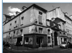
Figures nouvelles, figures anciennes du commerce en ville, éd. MEDDE/MLET, Puca. Ancienne boucherie chevaline transformée en boutique de mode dans le quartier du Marais à Paris.