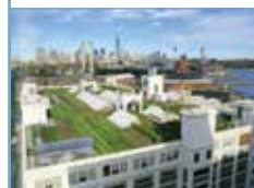
Jardins en ville. Villes en jardin , éd. Parentèses., "Navy yard farm", une ferme urbaine sur un toit à New York (2012, collectif Brooklyn Grange).