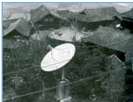
Regards sur le Guizhou, éd. Cité de l'architecture et du patrimoine. Village de Jialang en 2011 (Chine).

L'ordinaire et l'exceptionnel Françoise Ged Photo. Yang Hui Bahai Paris, Buchet/Chastel, 2014 (Coll. Document) 151 p., ill. noir, 14x20,5, 16 € ISBN 978-2-283-02757-8 Depuis les années 1980, l'auteure, architecte et responsable de l'Observatoire de l'architecture de la Chine contemporaine au sein de la Cité de l'architecture et du patrimoine, a séjourné à de multiples reprises à Shanghai. Dans un récit au style intimiste, elle raconte les évolutions urbaines, sociales et architecturales de la ville (Cf. Archiscopie, n° 132, été 2014).