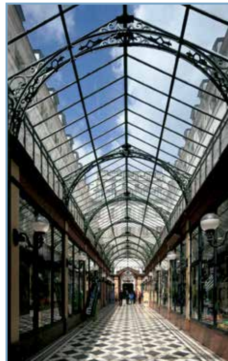
Passages couverts parisiens, éd. Parigramme. Passage des Princes dans le 2 e arr. (1860).

À la fin du XVIII e siècle, la spéculation immobilière fait naître de nouveaux temples dédiés au commerce, au luxe et aux plaisirs : les galeries et passages couverts. Ce guide, qui recense vingt passages encore accessibles à Paris, présente également une analyse historique,