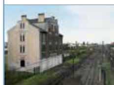
Atlas du Grand Paris 2013, éd. Wildproject. Ancienne gare de déportation de Bobigny.