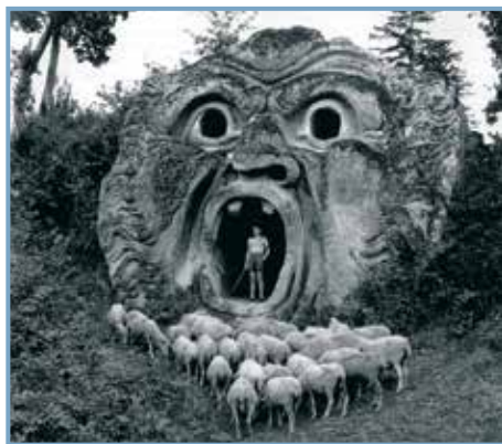
Bomarzo, éd. Ulmer. La gueule de l'enfer en 1952 (jardin de Bomarzo, Italie, XVI e siècle).

Créé à partir des années 1550, le bois sacré de Bomarzo dans le Latium (à 65 km au nord de Rome) est un exemple de jardin maniériste spectaculaire, fruit de l'imagination d'un humaniste lettré, le prince Vicino Orsini (1523-1585). Inspirés par la mythologie, la chevalerie, l'Antiquité, l'amour et le goût du mystère, les aménagements du jardin (terrasses, sculptures, jeux d'eau, fontaines, grottes, théâtre, temple...) composent un paysage fantastique. Visite illustrée et commentée de ce site ouvert au public.