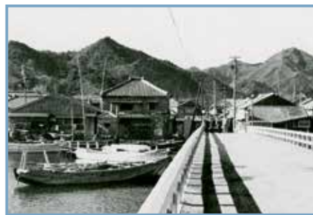
La Maison japonaise, éd. Le Linteau. Cabanes de pêcheurs à Izu.

Ouvrage publié à l'occasion de l'exposition éponyme organisée aux musées Gadagne de la Ville de Lyon du 21/11/2013 au 27/4/2014 Le 1 er mai 1914 est inaugurée une exposition internationale d'un nouveau genre dans le quartier de La Mouche à Lyon. Son instigateur, Édouard Herriot (sénateur-maire de Lyon), entouré du médecin hygiéniste Jules Courmont et de l'architecte urbaniste Tony Garnier (1869-1948), y expose son ambition urbaine : une Cité moderne. Les protagonistes, les enjeux et les objectifs de l'exposition (hygiène, éducation, industrie, arts), ses modèles (expositions de Dresde et de Gand), sa construction (le Grand Hall et futur abattoirs, T. Garnier arch.) ou encore sa postérité sont quelques-unes des facettes abordées dans cet ouvrage richement documenté.