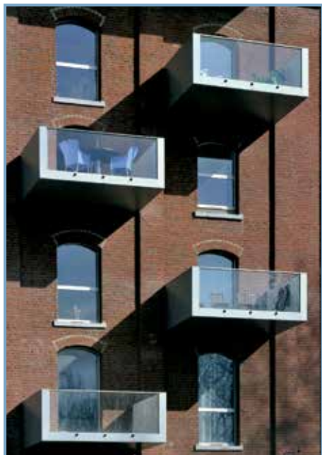
Métamorphoses, éd. Le Passage. Réhabilitation d'une ancienne minoterie en immeuble d'habitation à Roubaix (2008), Tank arch.

en musée d'art et d'industrie (1997-2000, J.-P. Philippon arch.).