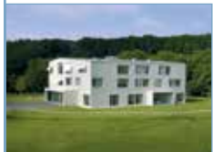
Des maisons pas comme les autres, éd. PPUR. Établissement médico-social Contesse à Croy (Suisse, 2003-2010), Frundgallina arch.

CETTE BIBLIOGRAPHIE SEMESTRIELLE, CRÉÉE À L'IFA EN 1985 ET ÉDITÉE PAR LA CITÉ, RECENSE LA PLUPART DES LIVRES RÉCEMMENT PARUS EN LANGUE FRANÇAISE DANS LES DOMAINES DE L'ARCHITECTURE, DE L'URBANISME ET DU PAYSAGE. SEULS SONT DÉSORMAIS RECENSÉS LES LIVRES QUE NOUS AVONS REÇUS, LES NOTICES ÉTANT FAITES APRÈS EXAMEN DU LIVRE.