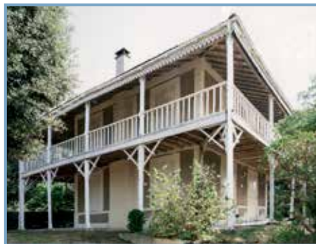
Soulac-sur-Mer, éd. Le Festin. Villa, rue de la Gare à Soulac-sur-Mer.

Arles, Errance, 2013 280 p., ill. noir et coul., 22x28, 35 € ISBN 978-2-87772-552-1 Menée dans le cadre de l'établissement du plan de sauvegarde et de mise en valeur du patrimoine architectural, urbain et paysager de Sommières, dans le Gard, cette étude pluridisciplinaire (histoire, architecture, archéologie, paysage, sociologie, économie) retrace l'histoire de la ville depuis ses origines paléolithiques jusqu'à nos jours. Parmi les édifices documentés : le pont romain, le château médiéval, hôtels particuliers Renaissance... Cartes, plans, photos.