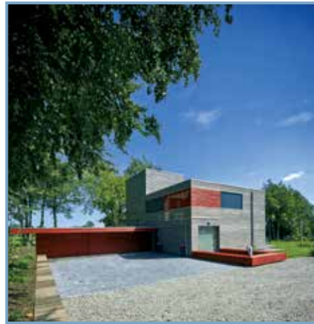
Made in wood, éd. Mardaga. Maison "passive" à Ovivat (Belgique, 2010), Crahay & Jamine arch.

invité d'honneur de la biennale) qui fut, après la révolution de 1974, un laboratoire expérimental pour l'habitat avec la création du SAAL (Service d'aide mobile locale).