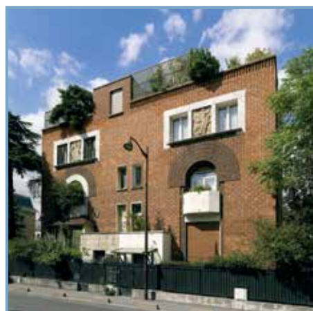
Architectures de briques en Île-de-France , éd. Somogy. Hôtel particulier à Neuilly.